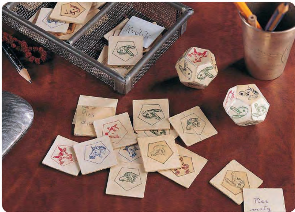
Originální hra „Chov zvířátek“ z roku 1943

U příležitosti 100. narozenin paní Borsukové, 25. výročí úmrtí jejího manžela a také u příležitosti 10. výročí obnovení výroby hry, jež nyní pod názvem Superfarmář baví další generace dětí i rodičů, přinesla Granna® na podzim roku 2007 novou, barevnější, prostornější a dynamičtější verzi, jejíž českou podobu vám nyní předkládáme.